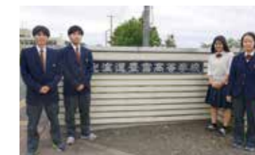
3 教育および少子化対策に関する事業 豊富高校間口対策事業(制服費等助成)