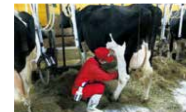
1 地場産業の振興に関する事業 酪農研修受入事業

今月号では、令和3年度ふるさと応援寄附金の状況と寄附金を活用して令和3年度に実施した事業の一部をご紹介します。