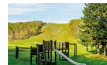
5 自然環境および地域景観の保全に関する事業 自然公園管理運営事業