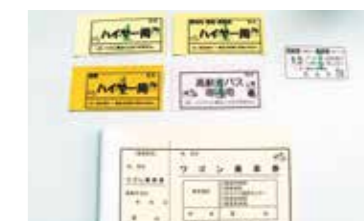
2 福祉、介護および医療に関する事業 高齢者生活交通費助成事業